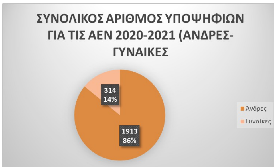
Πίνακας 1. Συνολικός αριθμός υποψηφίων για τις ΑΕΝ 2020-2021 (άνδρες-γυναίκες).