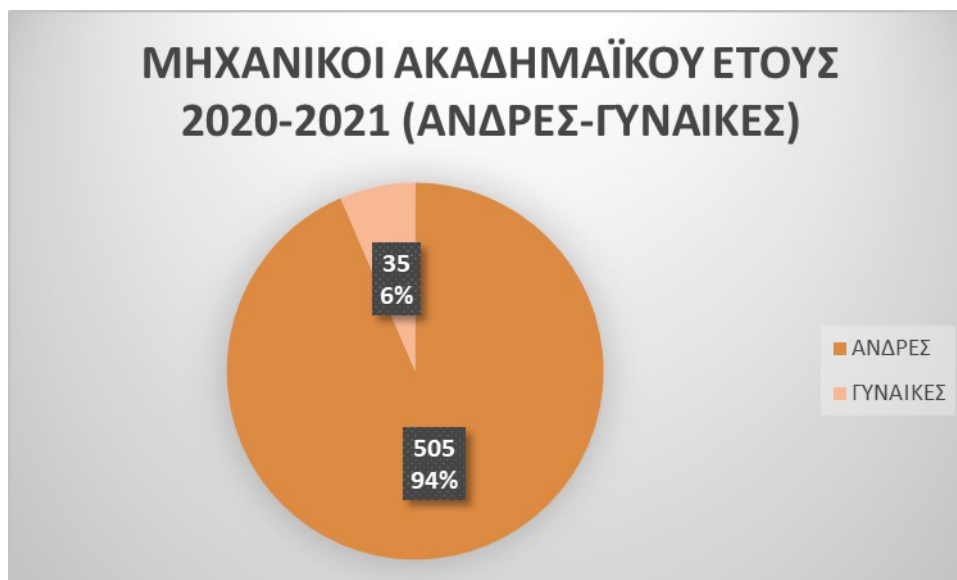
Πίνακας 5. Εισαγόμενοι σπουδαστές στις Σχολές Μηχανικών ακαδημαϊκού έτους 2020-2021 (άνδρες-γυναίκες).