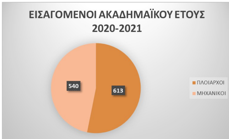
Πίνακας 3. Εισαγόμενοι σπουδαστές ακαδημαϊκού έτους 2020-2021 (Πλοίαρχοι- Μηχανικοί).